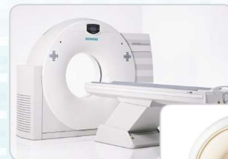
КТ - SIEMENS 16 СРЕЗОВ

ПРОВЕДЕНИЕ ВСЕХ ВИДОВ ТОМОГРАФИЙ НА ЛУЧШЕМ ОБОРУДОВАНИИ