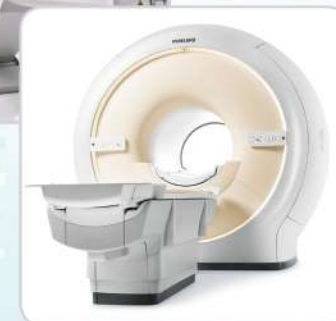
МРТ - PHILIPS 1,5 ТЕСЛА